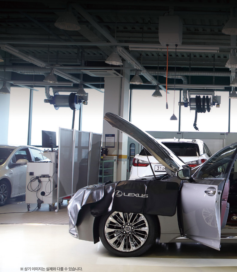
※ 상기 이미지는 실제와 다를 수 있습니다.

렉서스 Extended Warranty Program(이하 EWP) 프로그램은 신차 구매 시 제공되는 기본 보증 서비스가 종료된 이후, 1년 / 2만 km(선도래 기준) 동안 추가 보증 서비스를 제공하는 유상 서비스 상품입니다.