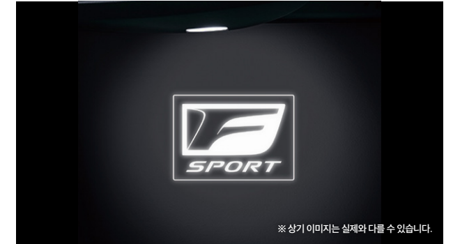
※ 상기 이미지는 실제와 다를 수 있습니다.

도어를 개방하자마자 LEXUS F SPORT의 아이덴티티를 나타내는 로고 일루미네이션입니다.