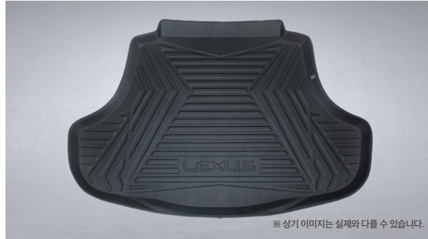
※ 상기 이미지는 실제와 다를 수 있습니다.

ES 300h 전용 트렁크 매트는 복합 코팅 기술을 적용해 표면의 내마모성과 스크래치 저항성을 높여 내구성을 강화하였습니다. 고온에서 압축된 매트는 방수에 효과적일 뿐만 아니라 청소에 용이하며, 미끄럼 방지를 위해 바닥면에 도트 패턴이 적용되어 있습니다.