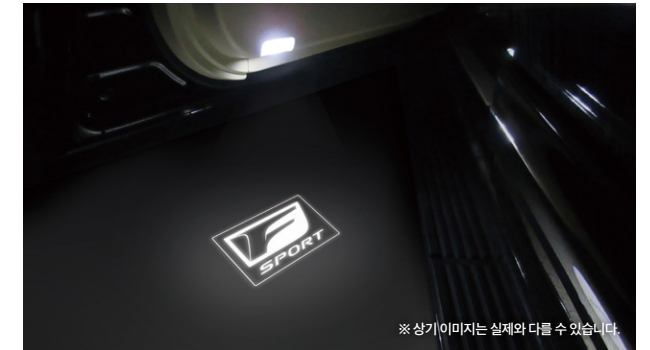
※ 상기 이미지는 실제와 다를 수 있습니다.